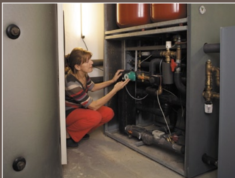
Energiezentrale: Die Steuereinheit für die gesamte Technik wurde im Keller in einem Block zusammengefasst. Das erhöht den Montage- und Betriebskomfort, spart darüber hinaus auch noch Platz.